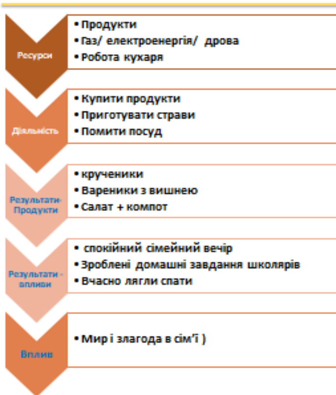
Рис.2. Приклад komponування елементів проекту

Формування кошторису проекту значною мірою залежить від вимог донора. В одних випадках (коли йдеться про міні-гранти) достатньо простого переліку статей витрат, в інших – кошторис проекту може займати кільканадцять сторінок з відповідними обґрунтуваннями ставок, цін, кількостей тощо.